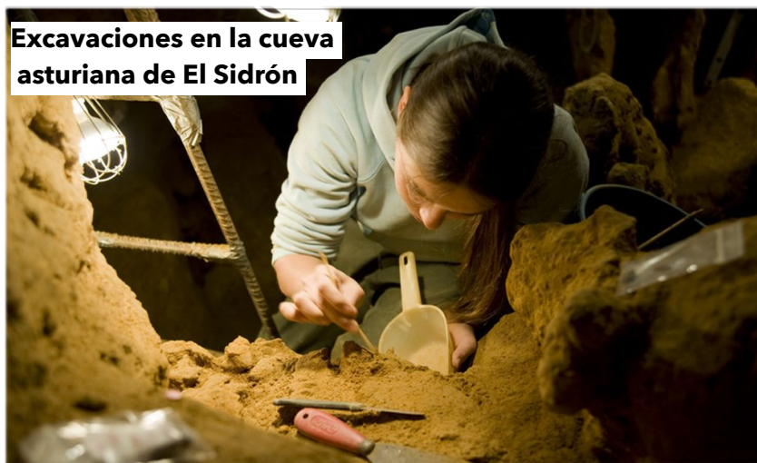
Excavaciones en la cueva asturiana de El Sidrón

Los análisis de esos cálculos dentales han permitido confirmar la ingestión de determinados alimentos, los que tenían a su disposición en cada caso. Encontraron evidencias del consumo de carne en los neandertales de Bélgica, que vivían en estepas frías con megafauna, mientras que los que ocupan la actual Asturias estaban en un entorno boscoso, más rico en vegetales.